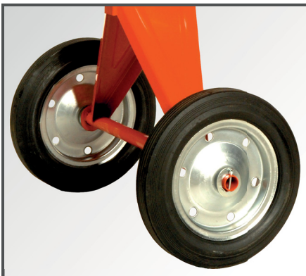
Große Räder (Ø 400 mm), mit Metallfelgen und pannensicherer Vollgummibereifung, für einen einfachen Transport.