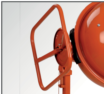
Ergonomisches & leichtgängiges Handrad mit Scheibenbremse & Fußbedienug für das stufenlose Verstellen der Mischtrommel.