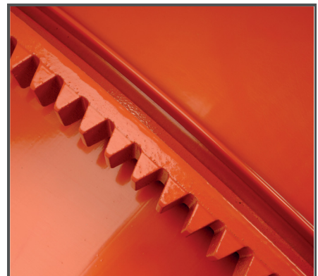
Hohe Lebenserwartung dank Pulverbeschichtung sowie abriebfestem Grauguss beim Zahnkranz und Antriebsritzel.